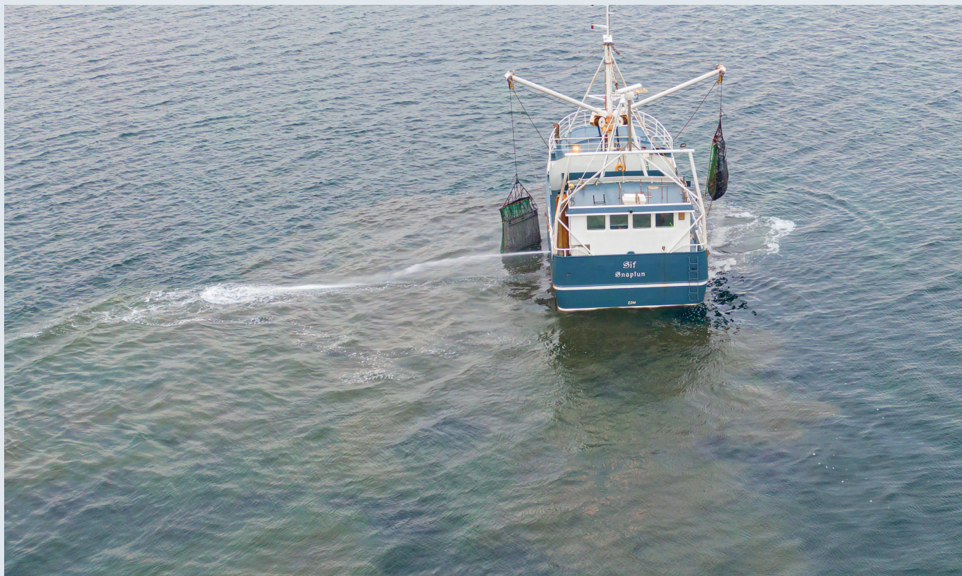
Her er de to trawl ved at blive sat i vandet igen. Bemærk, hvor meget sand og mudder, der er trukket med op fra havbunden.

Det er ikke nemt at hjælpe miljøet i bugten så længe, det er lovligt at fiske muslingerne. En klassisk, oplagt og effektiv måde er at boykotte blåmuslinger hos fiskehandlere og i supermarkeder og på den måde fjerne det økonomiske incitament til at fiske muslinger i Danmark. En anden og måske bedre mulighed er at arbejde for, at muslingefiskeri bliver forbudt her i lighed med andre steder, så længe miljøet i Kalø Vig er så belastet, som det er.